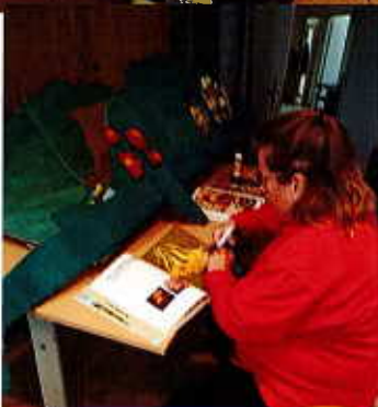
Le printemps pointe son nez...