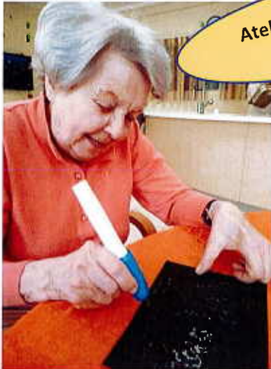
Atelier de Pyrogravure... au stylet.